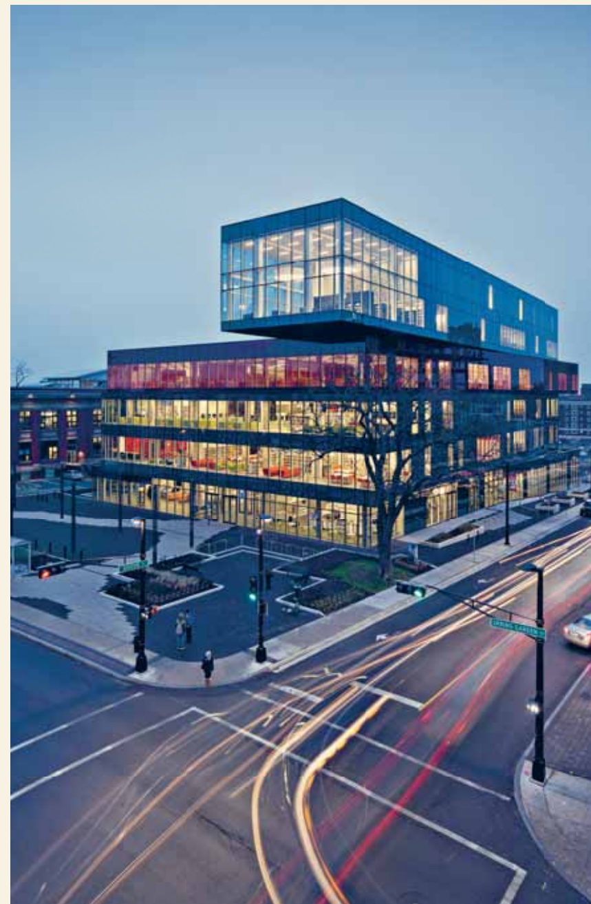
Halifax Central Library | 加拿大