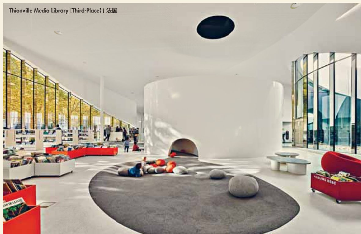
Thionville Media Library [Third-Place] | 法国