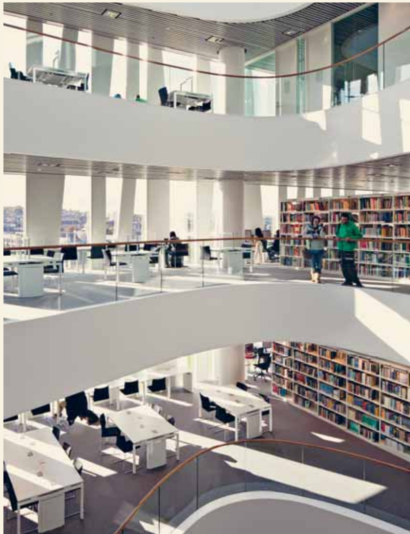
Sir Duncan Rice Library

纳入毛利部落纳塔胡文化，完成后将成为包含书籍、文物收藏展示，以及休闲阅读和视听活动的城市中心，鼓励市民参与。