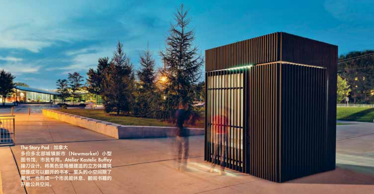
The Story Pod | 加拿大 多伦多北部城镇新市 (Newmarket) 小型图书馆，市民专用。Atelier Kastelic Buffey 操刀设计，将黑色竖格栅建造的立方体建筑想像成可以翻开的书本，里头的小空间除了藏书，也形成一个市民能休息、翻阅书籍的开放公共空间。