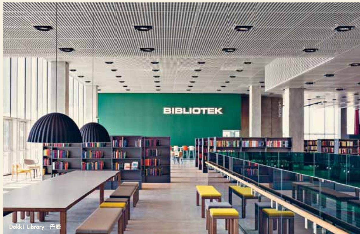
Dokk1 Library | 丹麦

Harvard Library 世界上藏书最多、规模最大的大学图书馆，是哈佛大学图书馆，也是美国最早的图书馆。曾有五位美国总统、三十多位诺贝尔奖得主在这里学习过，因而让图书馆蒙上传奇色彩。