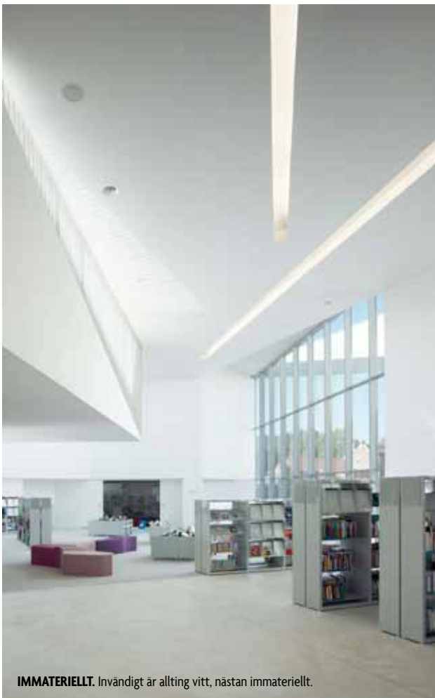
IMMATERIELLT. Invändigt är allting vitt, nästan immateriellt.

”DEN STÖRSTA UTMANINGEN VAR NOG SJÄLVA KUNDEN.”