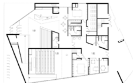
PLAN 1. Entréhall.