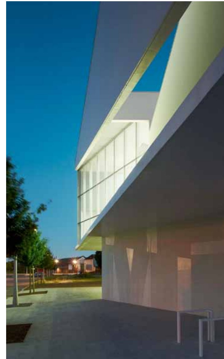
RIKTNINGAR OCH VINKLAR. Det naturliga ljusintaget förändras i takt med dagen.

”ALLT ÄR VITT, MEN SAMTIDIGT SÅ MYCKET MER ÄN BARA VITT.”