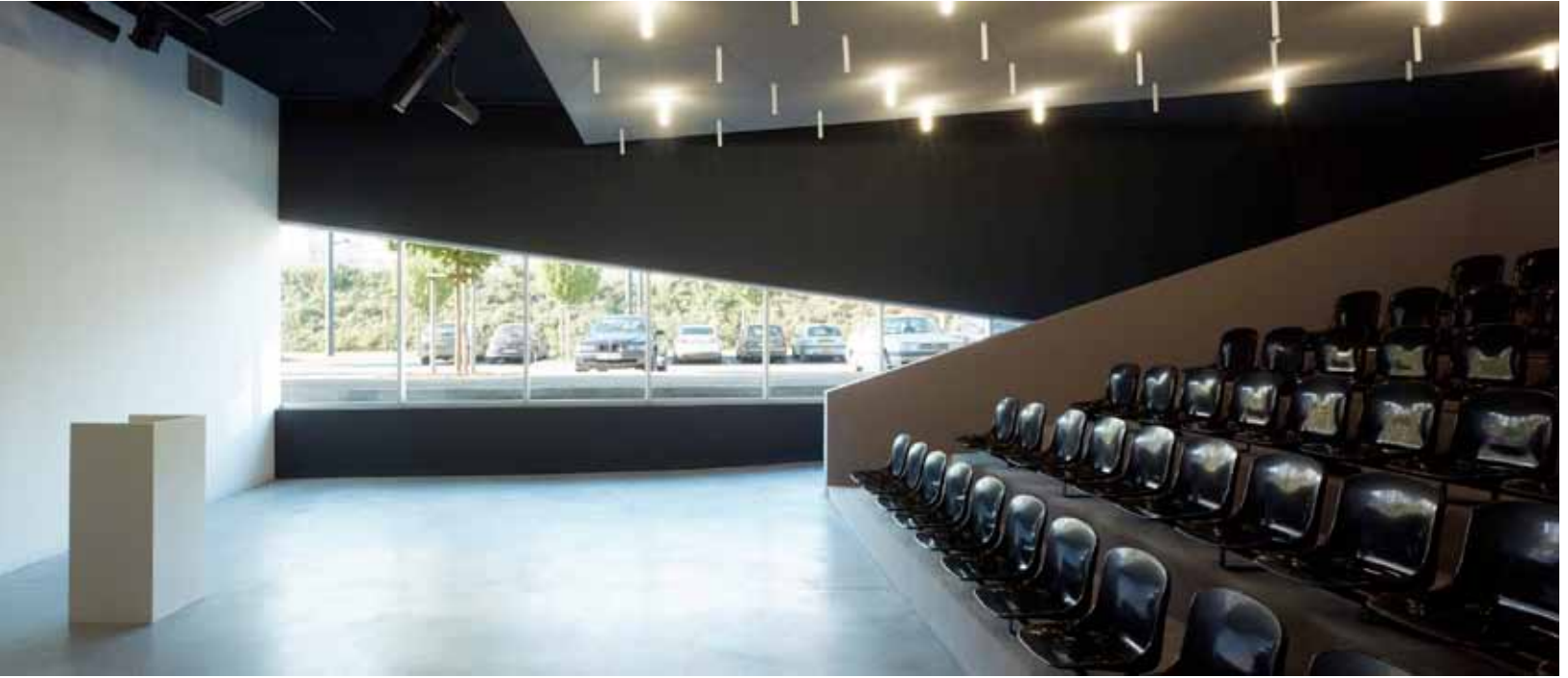
PÅ ENTRÉPLAN. Mediatekets auditorium med plats för 100 personer.

”DEN STÖRSTA UTMANINGEN VAR NOG SJÄLVA KUNDEN.”