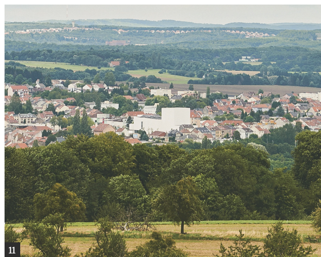
DOMINIQUE COULON & ASSOCIÉS