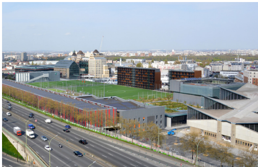
Complexe sportif Jules Ladoumègue, Paris 19 e © Jan Feichtinger.

> L'OBSOLESCENCE DES ÉQUIPEMENTS DES ANNÉES 60-70 : DÉMOLITION / RECONSTRUCTION OU RÉHABILITATION / RESTRUCTURATION ?