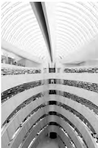
9. Santiago Calatrava, Bibliothek des Rechtswissenschaftlichen Instituts der Universität Zürich, 1994.

Dominique Perrault à la BnF est parvenu à concilier l'immensité d'un long espace et son fractionnement en salles consacrées à des sujets distincts. Les voiles de résille