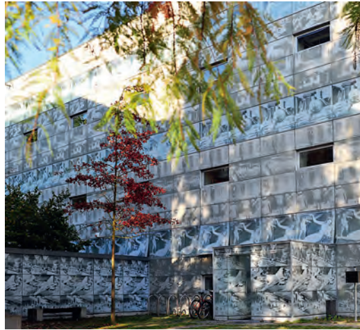
7. Herzog & de Meuron, bibliothèque, Hochschule für nachhaltige Entwicklung à Eberswalde, 1999.

où flottent des « embryons » de toutes les formes de la mémoire : livres, disques, instruments d'optique, microfiches, ordinateurs (fig. 5). Cette indétermination correspond à l'imprécision du programme du concours et plus encore à l'incertitude des conséquences des technologies numériques. Quelques années après l'échec de son projet parisien, Koolhaas a pu concrétiser ses conceptions en réalisant le Bibliothèque centrale de Seattle (2004). Cet édifice spectaculaire piège dans ses façades de verre les reflets diffractés des tours environnantes (fig. 6a). Ses volumes contrastés alternent dilatation et contraction offrant l'image incohérente d'une composition impossible. À sa conception préside