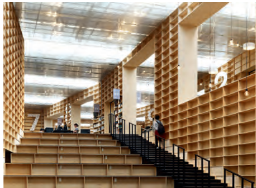
3. Sou Fujimoto, bibliothèque de la Musashino Art University, 2010.

Ce n'est pas le cas de la BnF de Dominique Perrault dont les quatre tours représentent des livres colossaux et explicitent, de façon « parlante », leur fonction originelle de magasins destiné à accumuler des ouvrages dont on aurait vu le niveau progressivement monter. Il ne serait être question de revenir en détail sur le concours et la réalisation de cet édifice. Mais il est nécessaire de rappeler que la « Très Grande Bibliothèque » est née au moment où les nouvelles technologies faisaient pour la première fois sentir leurs effets. Le président de la République française, révélant son projet lors d'une interview en juillet 1988 avait déclaré vouloir une bibliothèque « qui puisse communiquer [le] savoir à l'ensemble de ceux qui cherchent, ceux qui étudient, ceux qui ont besoin d'apprendre, toutes les universités, les lycées, tous les chercheurs qui doivent trouver un appareil modernisé, informatisé 4 ». La question d'une bibliothèque « connectée » pour reprendre les mots de François Mitterrand, était inscrite dans le texte du concours, mais bien peu d'architectes, parmi les 244 invités, ont su ou voulu lui donner une forme architecturale ( Premiers volumes , 1989).