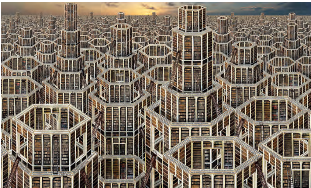
2. Jean-François Rauzier, Bibliothèque Babel , 180 × 300 cm, 2013.

Les documents numériques disponibles grâce à Internet présentent d'ores et déjà de multiples avantages et le discours sur leur inconfort semble étranger aux générations de « l'écran global ». Si l'on continue à publier toujours plus de livres dans le monde, c'est probablement pour des raisons plutôt symboliques et sous l'influence de facteurs d'inertie bien naturels. On ne passe aisément d'un document dont la matérialité et le contenu indique