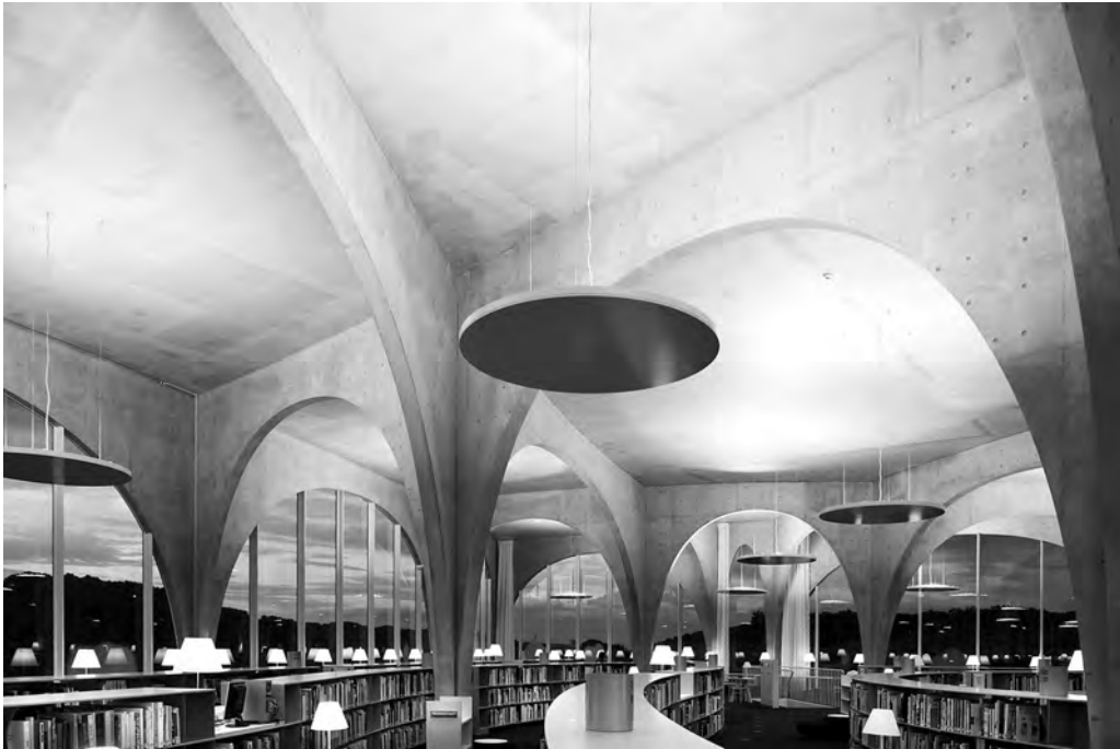
10. Toyō Itō, Bibliothèque d'art de Tama, Tokyo, 2007.

métalliques en maille d'acier suspendus masquent les réseaux et la structure au plafond avant de redescendre verticalement pour fermer le volume sur la face opposée aux grandes baies. Du Besset-Lyon pour la médiathèque de Troyes (2002) ont retenu un parti semblable avec une nappe de tubes de métal doré qui flotte au-dessus des espaces pour les éclairer en les unifiant visuellement. Dans les deux cas les rayonnages permettent de délimiter les espaces et de limiter le nombre de lecteurs dans le champ visuel de l'utilisateur. Toyō Itō, pour la bibliothèque d'art de Tama, près de Tokyo (2007), élabore un jeu d'arches qui croisent leurs portées sur toute la superficie (fig. 10). Leur implantation suit de légères courbures et les rayonnages serpentent entre les retombées. Les grands pleins-cintres évoquent l'architecture religieuse occidentale et l'image de recueillement qui l'accompagne.