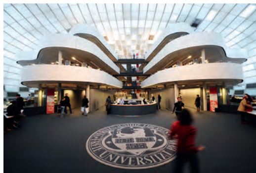
4. Foster + Partners, Philologische Bibliothek, Freie Universität Berlin, 2005.