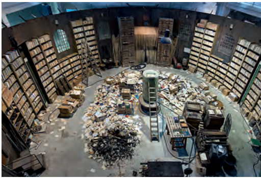
1. Robert Kuśmirowski, Stronghold , 2011, 11 e Biennale de Lyon, La Sucrière.

les professionnels des bibliothèques ont initié des études prospectives ambitieuses (AROT, BERTRAND, DAMIEN, 2011).