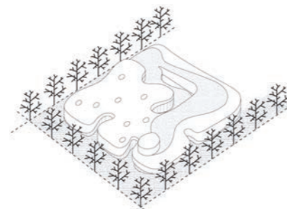
6. Couronne d'arbres existante comme dernière épaisseur du bâtiment

◀ Inscrit dans un carré de 72 m de côté, la plan s'organise autour d'un patio central le scindant en deux parties. © Dominique Coulon & associés