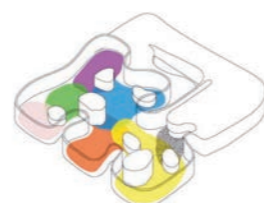
3. Les 6 univers de la médiathèque + studio création