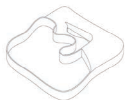
2. Masse compacte du programme / plan libre de la médiathèque et rampe vers le toit terrasse