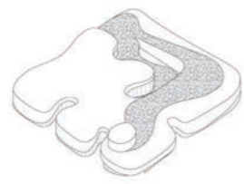
5. Circulation verticale et bar d'été comme point culminant du jardin rampe