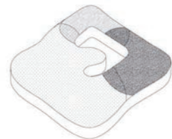
1. Interaction entre les trois programmes autour du patio