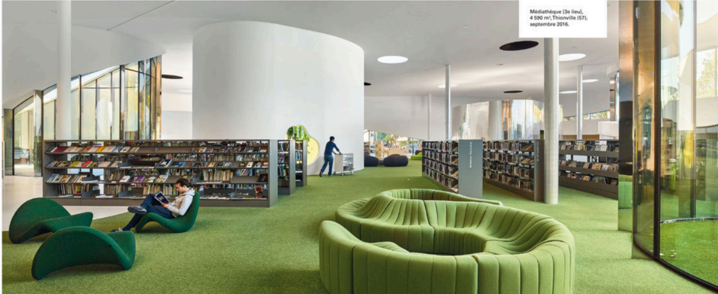
Médiathèque [3e lieu], 4 590 m 2 , Thionville (57), septembre 2016.