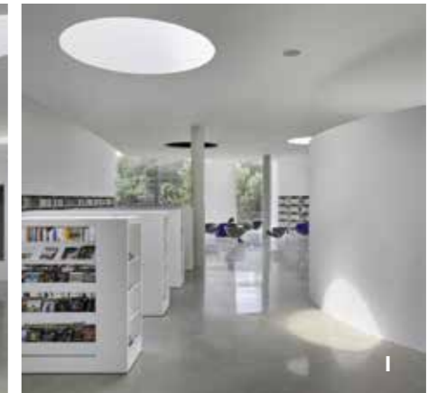
I L'association de volumes très ouverts et de salles plus fermées crée des variations d'atmosphère et diversifie les espaces.