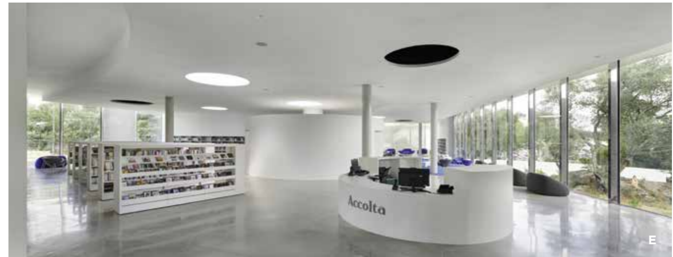
E Sobre et simple, le hall de la médiathèque accueille de manière la plus ouverte possible.